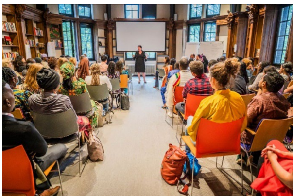
Opening academisch jaar in de leeszaal.

In 2023 is € 341.812 aan giften ontvangen bestemd voor beurzen. Het totaal bedrag aan toegekende beurzen in 2023-2024 bedraagt € 306.136. Een volledige beurs bedraagt in 2023 € 37.562 en een deelbeurs € 19.180.