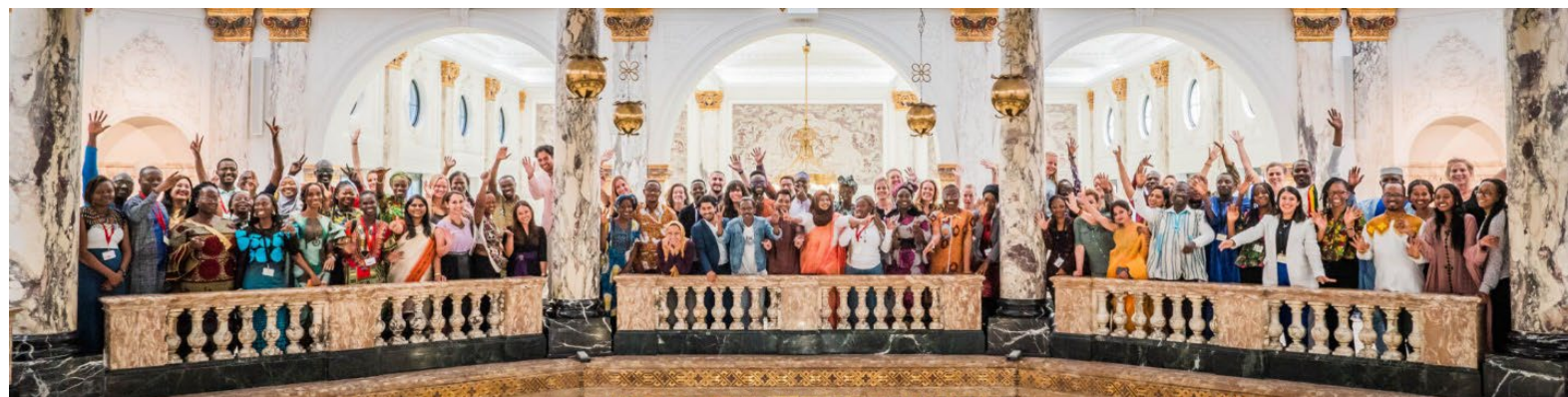
Deelnemers van de Master in Public Health en International Health bij de opening van het academische jaar 2023-2024.

KIT Fonds heeft als doel bij te dragen aan een meer inclusieve en rechtvaardige samenleving door middel van kennisvergaring en kennisdeling in lage en middeninkomenslanden (en Nederland) vanuit het Koninklijk Instituut voor de Tropen of in samenwerking met andere organisaties. We zijn ervan overtuigd dat investeren in toekomstige leiders en experts in gezondheidszorg bijdraagt aan duurzame verbetering van de gezondheidszorg, lokaal en internationaal. Daarom streven we ernaar om met het KIT Fonds een groeiend aantal veelbelovende gezondheidsprofessionals uit lage inkomenslanden studiebeurzen aan te bieden om een Masters opleiding Public Health of International Health aan het KIT te studeren. Daarnaast werft het Fonds sinds dit jaar middelen voor toegepast onderzoek en kennisdeling voor systemische verandering op het gebied van gezondheidszorg, duurzame economische ontwikkeling en gendergelijkheid.