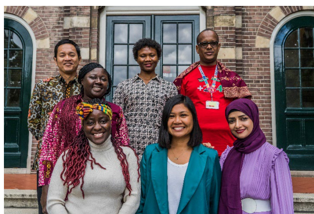
De studenten die met een beurs van het KIT Fonds een Master hebben gevolgd (2022-2023)