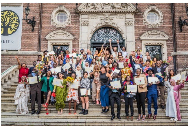
Afstudeer ceremonie 2022-2023

In september 2023 vond op het KIT de feestelijke afstudeerceremonie plaats in de Máximazaal van het KIT. Deze kon tevens via een online stream door familie en vrienden over de hele wereld gevolgd worden.